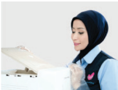
Servis Regular 2 Bulan

Semua produk water purifier Coway telah disertifikasi Water Quality Association (WQA). Beli dengan Package 72 , dan nikmati Coway HEART SERVICE™ kami selama 72 bulan.