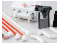
Gratis Instalasi dan Servis Setelah Pembelian

* Remark) For reasons not responsible for the customer during the monthly payment contract, if the product is broken, damaged or lost, we will repair and replace parts free of charge. But if your monthly payment is overdue or unpaid, your service may be stopped.