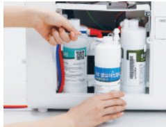
Filter Gratis dan Servis Reparasi