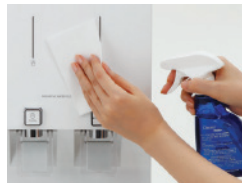
Servis Perawatan Gratis