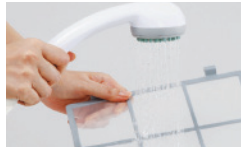
Servis Reguler 2 Bulan

Semua produk air purifier Coway telah disertifikasi Clean Air Certificate (CA). Beli dengan Package 72 , dan nikmati Coway HEART SERVICE™ kami selama 72 bulan.