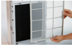
Filter Gratis dan Servis Reparasi