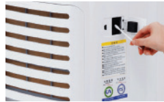
Servis Perawatan Gratis