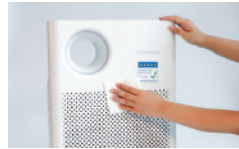
Gratis Instalasi dan Servis Setelah Pembelian

* Keterangan) Pelanggan tidak perlu bertanggung jawab selama kontrak cicilan bulanan sedang berlangsung saat produk rusak, hancur atau hilang. Kami masih akan tetap memperbaiki dan mengganti suku cadang secara gratis. Namun jika pembayaran bulanan Anda terlambat atau belum dibayarkan, layanan Anda akan dihentikan.